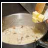
Finalizar/"mantecare" conforme a receita e servir.

As receitas que se seguem ilustram a confeção numa só fase. Adapte-as à sua cozinha profissional com estas duas fases.