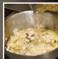
Adicionar o restante caldo ou base do sabor desejado ao arroz pré-cozido (ex: base de marisco).