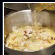
Juntar cerca de 40% do caldo e deixar absorver, durante 8 minutos no máximo.