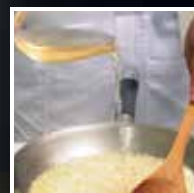
Refrescar o refogado com vinho.