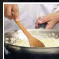
Deixar cozinhar o arroz até ficar no ponto (não deve ser muito mexido para não libertar amido em excesso).