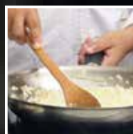
Deixar cozinhar o arroz até ficar no ponto (não deve ser muito mexido para não libertar amido em excesso).