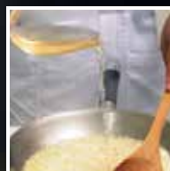
Refrescar o refogado com vinho.